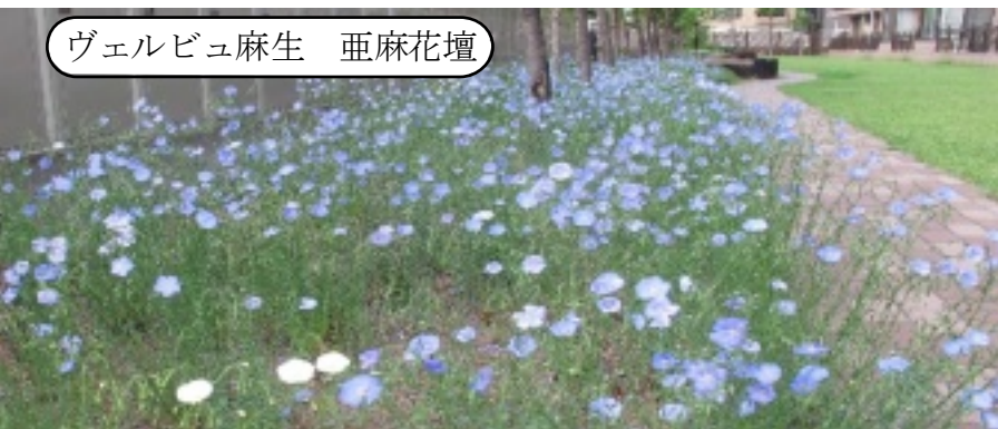
ヴェルビュ麻生 亜麻花壇