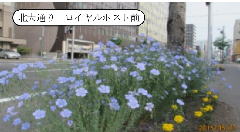
北大通り ロイヤルホスト前