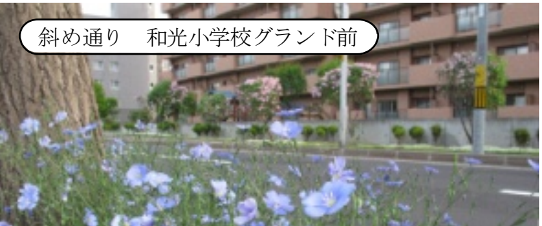
斜め通り 和光小学校グラウンド前